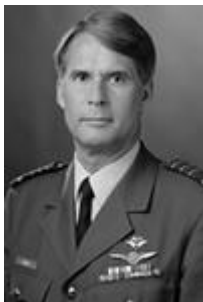
Missie leider: Generaal Dick Berlijn, Commandant der Strijdkrachten in de Nederlandse

De Intersec Expo and Conference Dubai 2012 is gericht op politie, defensie en de (openbare) veiligheidssector. Het is een unieke gelegenheid om uw bedrijf doeltreffend te positioneren en bekendheid van uw naam, product, dienst te bereiken om nieuwe zakelijke kansen te creëren.